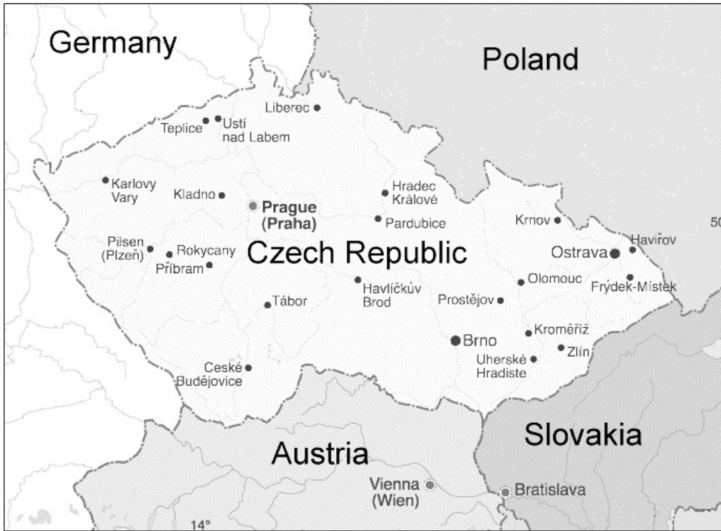
Χάρτης της Τσεχίας